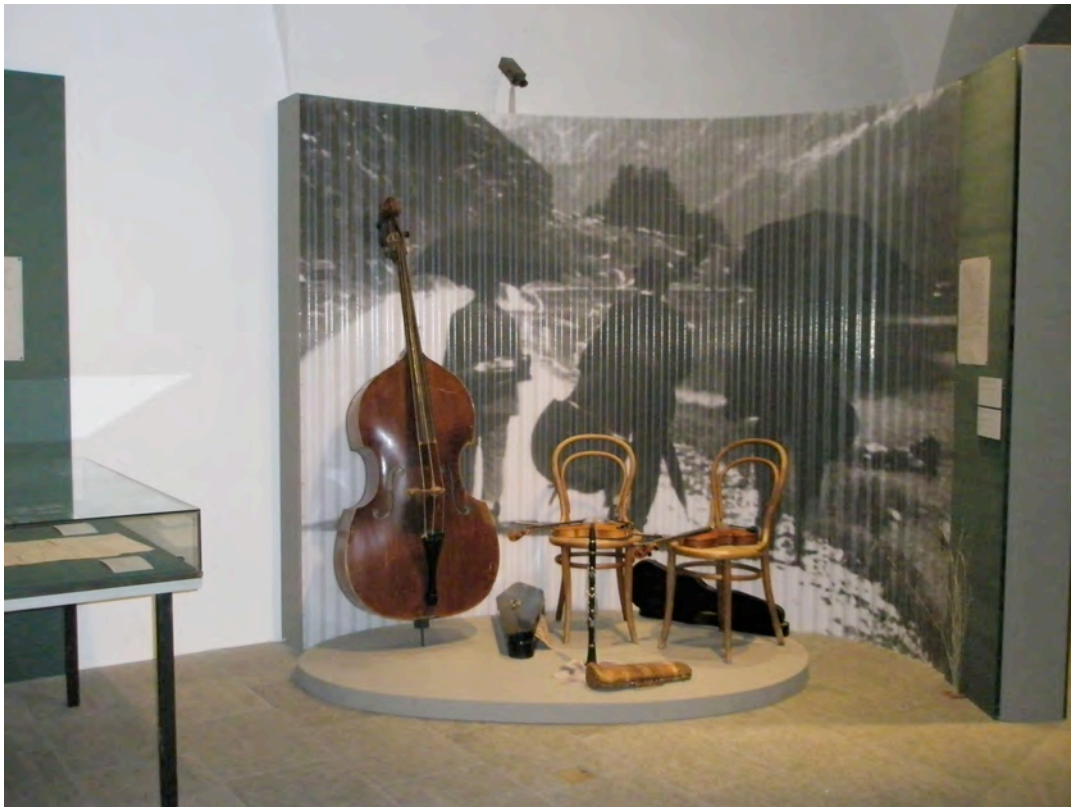
Die Fotografie der "Fränzli" bei Sils, die sich im Nachlass Camille Hofmann im Kulturarchiv befindet, hat das Rätische Museum in der Ausstellung "Puur und Kessler - Sesshafte und Fahrende in Graubünden" (19. September 2008 bis 25. Januar 2009) als Rückwand für die Inszenierung der legendären Musikgruppe verwendet.