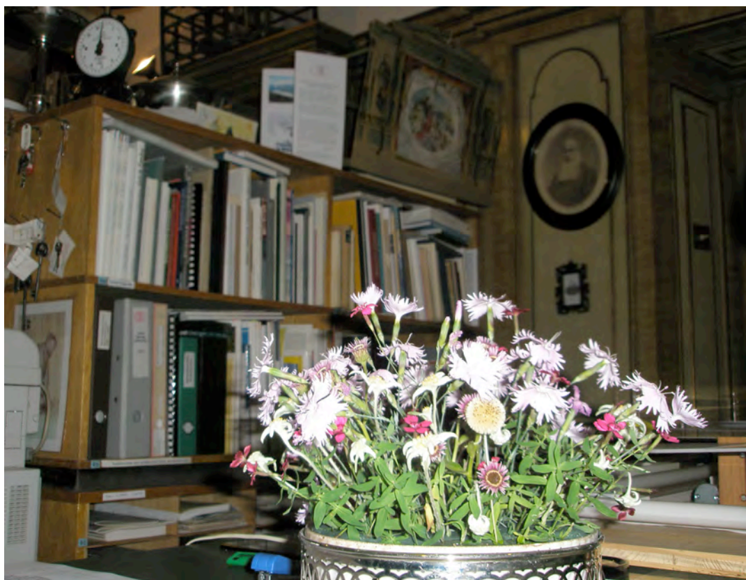
Das Kulturarchiv Oberengadin feierte am 11. August 2008 sein 20-Jahr-Jubiläum. Die Führungen durch das Archiv und die Vorträge in deutscher und italienischer Sprache wurden rege besucht. Foto: Blumenarrangement von Lydia Albrecht im Büro des Kulturarchivs